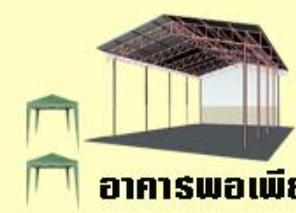
อาคารพอเพียง

ฝั่งงานการแข่งขันทักษะทางวิชาการนักเรียน มหกรรมการจัดการศึกษา สังกัดองค์การบริหารส่วนจังหวัดศรีสะเกษ ครั้งที่ 13 ประจำปี 2563