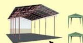
โรงจอดรถ6ล้อ